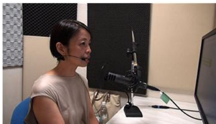
「ボイスバンク」で「声のドナー」として朗読するボランティア

上記ご紹介のテレビ取材のほかにも、ラジオ出演（TBS ラジオ）、新聞連載記事（朝日新聞）、および医療系イベントなどがございました。取材へのご協力、ありがとうございました。